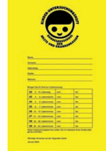
Çocuk sağlık kontrol karnesi

Çocuğunuz doğduktan sonra size bir çocuk muayene karnesi verilecektir. Burada çocuğunuzun 14 yaşına kadar yapılan tüm muayeneler kayıtlıdır: