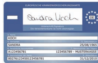
Muster einer Versichertenkarte (Rückseite) Sigortalı kartı örneği (Arka yüz)

Doktor hizmetlerini doğrudan ilgili sağlık sigortası kurumuna fatura eder.