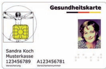
Muster einer Versichertenkarte (Vorderseite) Sigortalı kartı örneği (Ön yüz)

Der Arzt rechnet dann direkt mit der Krankenversicherung ab.