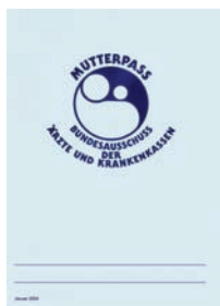
Mutterpass Deckblatt Anne karnesi: kapak sayfası

Die Schwangere sollte den Mutterpass immer mit sich führen, damit ihr und dem werdenden Kind in einer Notsituation besser geholfen werden kann. Der Mutterpass muss bei jedem Arzt-, Krankenhaus- oder Zahnarztbesuch vorgezeigt werden. Bei Schwangeren dürfen nämlich viele Medikamente nicht verabreicht und manche Untersuchungen nicht durchgeführt werden.