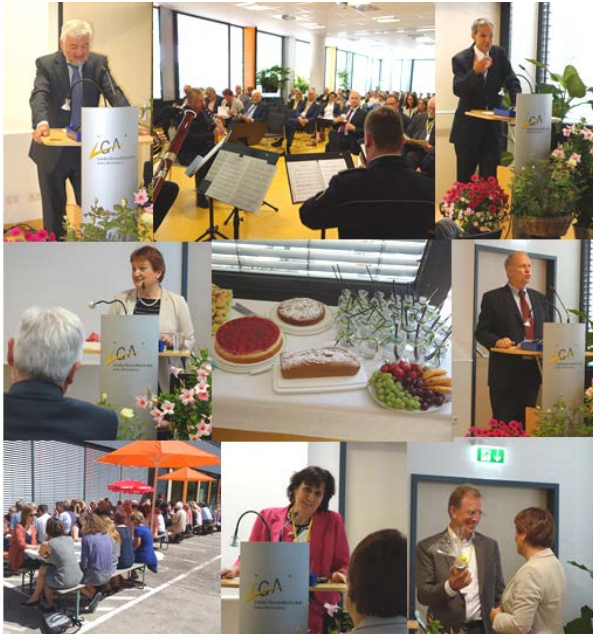
Abbildung 1: Impressionen aus der LGA-Jubiläumsfeier

Am 5. Juli 2016 feierte das Landesgesundheitsamt Baden-Württemberg (LGA) sein 25-jähriges Bestehen.